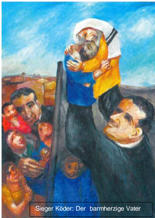
Sieger Köder: Der barmherzige Vater

Auf dem Bild spielt Don Bosco seinen Mitarbeitern und Jugendlichen das Gleichnis vom verlorenen Sohn und dem barmherzigen Vater vor. Er will sagen: Seid nicht so wie der ältere Bruder (unten) sondern seid so wie der gute Vater. So wie er, so ist Gott. er weiß alles, er straft nicht, sondern heilt durch seine barmherzige Liebe. Das ist die Therapie Gottes. Sie hilft uns und mit ihr können auch wir einander helfen.