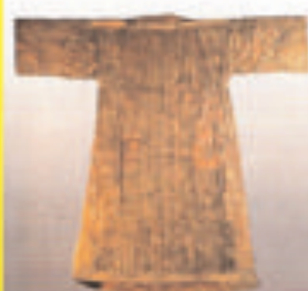
DER HEILIGE ROCK ZU TRIER