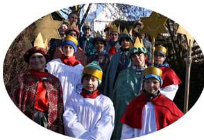
St. Johannes Baptist