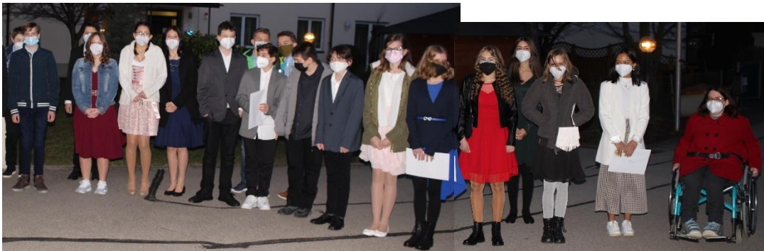
Gruppe 1, 12. März 2021