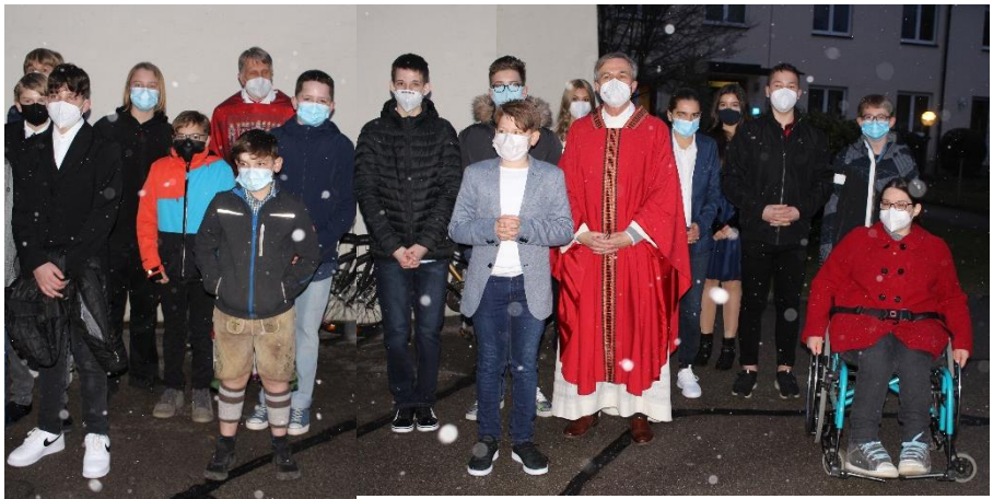
Gruppe 2, 19. März 2021