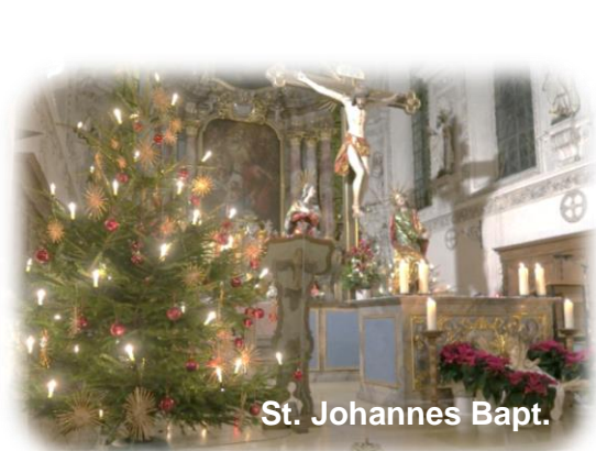
St. Johannes Bapt.