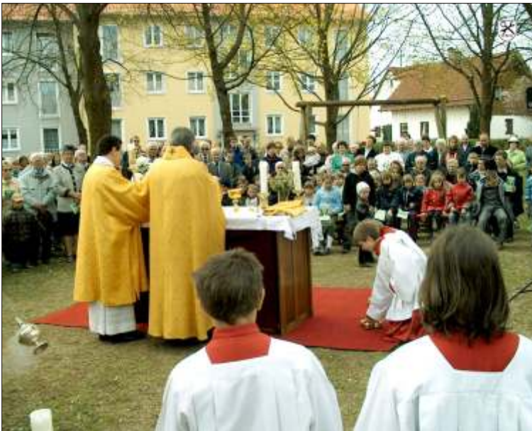
Ostermontag-Emmausgang - Familiengottesdienst im Freien