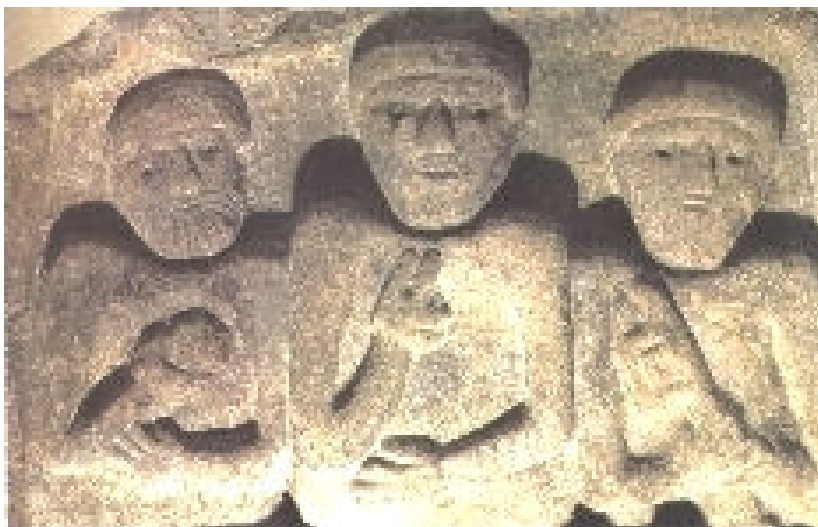
Zeugen des Glaubens: Stephanus-Christus-Petrus, Dom zu Brixen um 950

Der Größte von euch soll euer Diener sein. (Mt 23, 11)