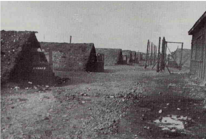
Die halbunterirdischen Baracken des Lagers Kaufering III.

Auf die historischen Spuren der „Macht des Bösen“ begaben sich die Firmlinge bei einem Vorbereitungstreffen am Freitag, 31.03.2006, und wanderten mit Pater Schaumann zur KZ-Gedenkstätte des ehemaligen Lagers Kaufering III . Dort erzählte Ihnen Norbert Sepp von den Gräueln, die dort in unserer unmittelbaren Umgebung in den letzten Kriegsjahren geschahen: „Ringeltaube“ hieß das irrsinnige Rüstungsprojekt der Nazis und „Vernichtung durch Arbeit“ war das zynische Motto der NS-Verbrecher, denen viele, zumeist