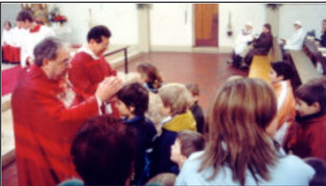
Kindersegnung am 2. Weihnachtsfeiertag

Wir wollen eine Kultur des Lebens pflegen. Das christliche Ja war im Altertum und ist heute ein großes Ja zum Leben. Es ist ein dreifaches Ja zum lebendigen Gott, zu Christus , zu einem Gott, der nicht