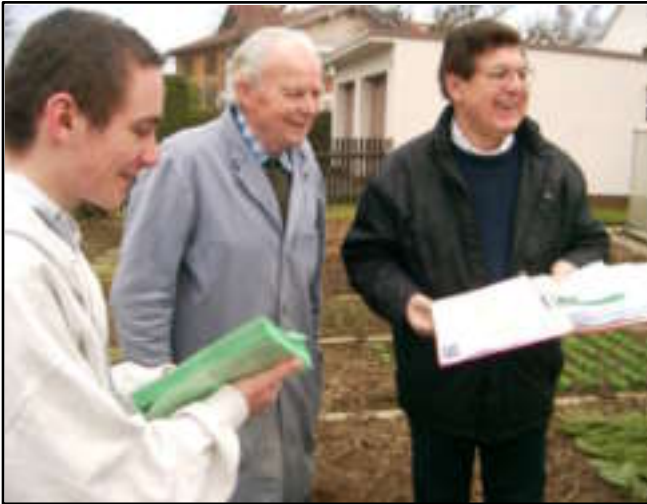
Besuch der „Frühschicht“ in seinem Garten.