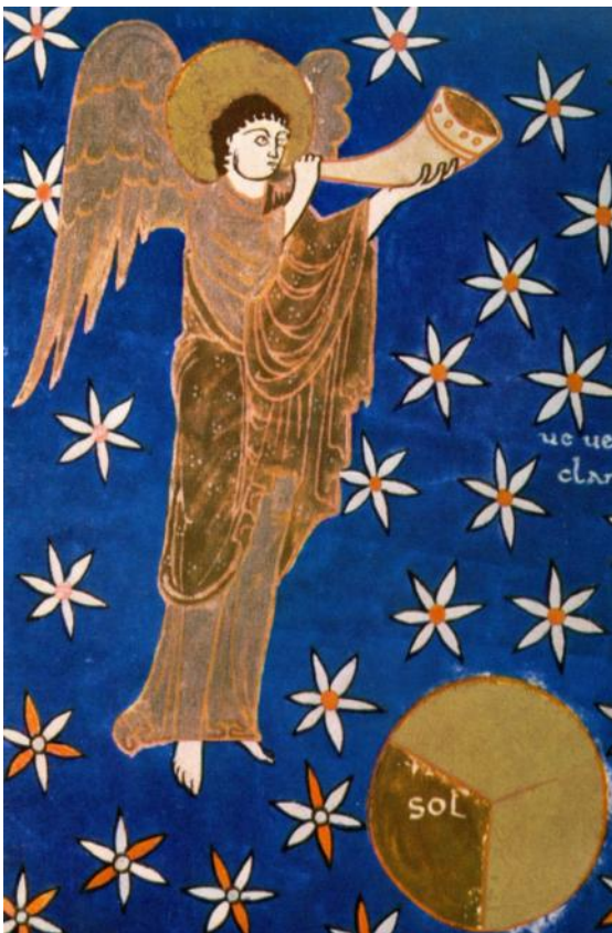
Engel mit der Posaune, Paris 1050

Advent ist nicht nur das Warten auf das Kommen Jesu als Kind von Bethlehem. Advent ist auch das Warten auf das Kommen Jesu am Ende meines Lebens.