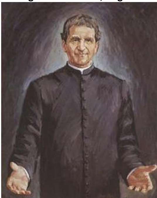
(Don Bosco 1815 – 1888)

Dieses neuere Don Bosco Bild zeigt uns den Priester und Freund der Jugend: